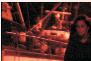
Se la mia amica entrasse di Cristina Vuolo, 10', ITALIA 1995, Sperimentale, IMMAGINARIA 1996

Franca e Antonia sono state amanti. Antonia è morta, e Franca la ricorda. Storia triste e banale: un pretesto messo in scena per dire altro. Benchè sovrapposte, le immagini e le parole nel video non raccontano la stessa storia: l'atmosfera è data dal mescolarsi e separarsi della narrazione. Le immagini parlano di una vicenda che deve ancora compiersi e di una donna che ne vagheggia un'altra nella sua fantasia; al contrario le parole dicono di un amore già finito "se la mia amica entrasse io sarei felice di vederla".