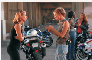
F*Stop di Roberta Degnore, 10', USA 2004, Narrativo, IMMAGINARIA 2005