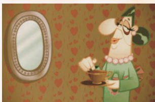
Granny queer - The Late bloomers di Jacinda Klouwens, 7', AUSTRALIA 2004, Animazione, Premio del Pubblico IMMAGINARIA 2005

Due lesbiche di una certa età si stanno godendo un effervescente sabato mattina, quando Granny si accorge che i mutandoni di Sharlene sono scomparsi dal filo dei panni stesi. Granny sospetta che il colpevole sia il loro nuovo misterioso vicino di casa, Mr. Wit, ed è determinata ad andare in fondo alla questione.